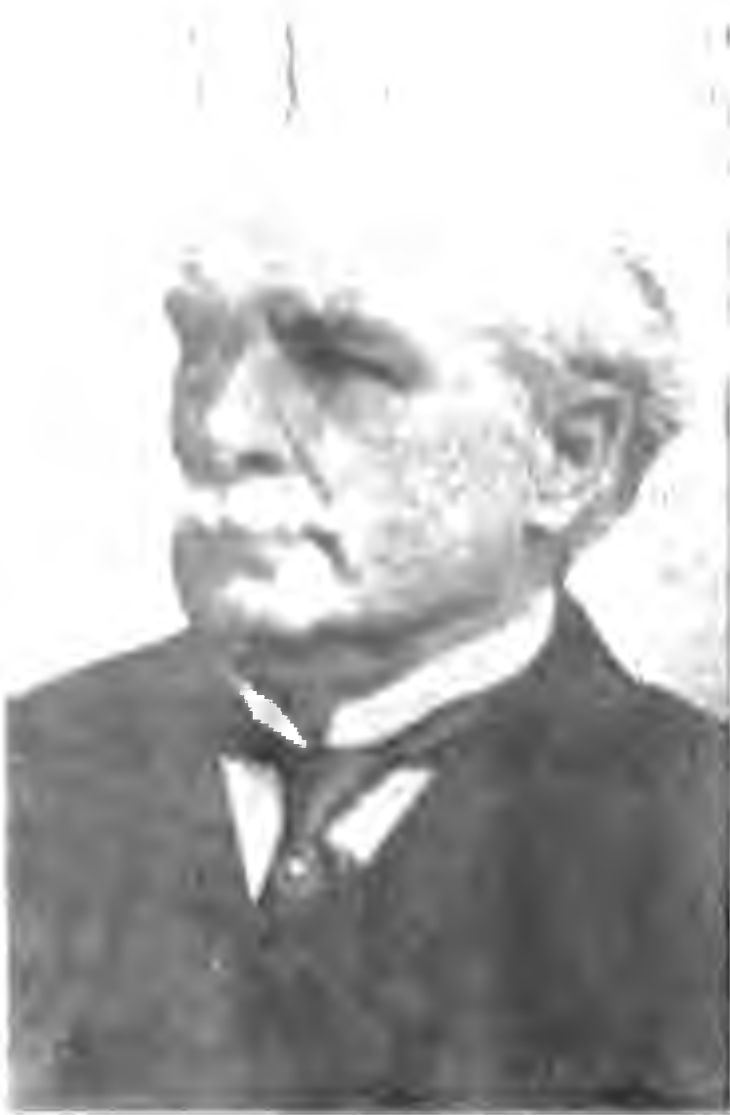
دافيد لويد جورج (١٨٣ - ١٩٤٥)