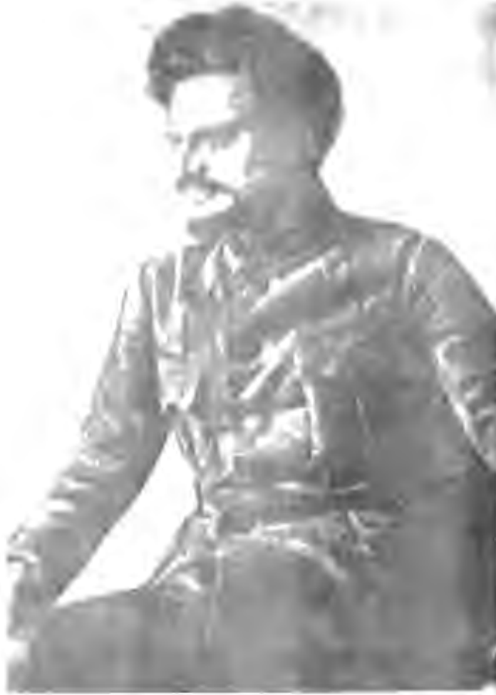
تروتسكي (١٨٧٧ - ١٩٤٠)