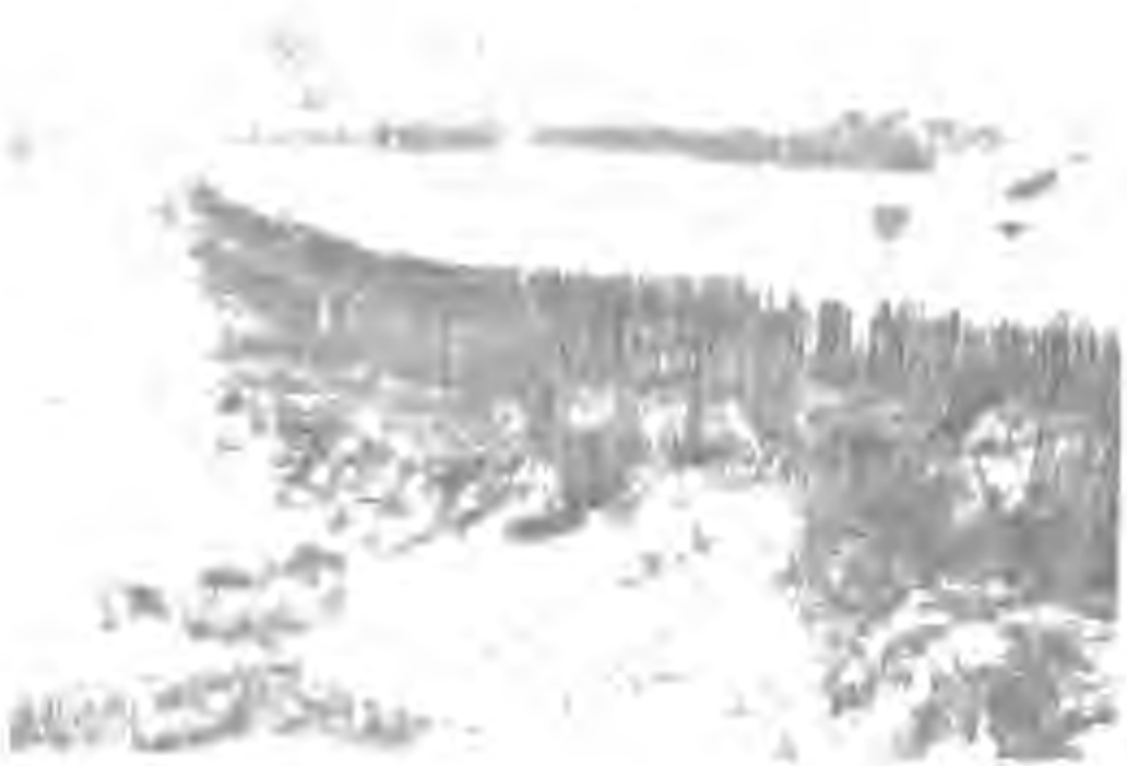
موانع مضادة للدبابات في مطلع الحرب العالمية الثانية