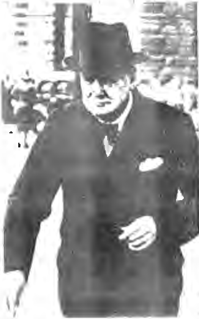
ونستون تشرشل (١٨٧٤ - )