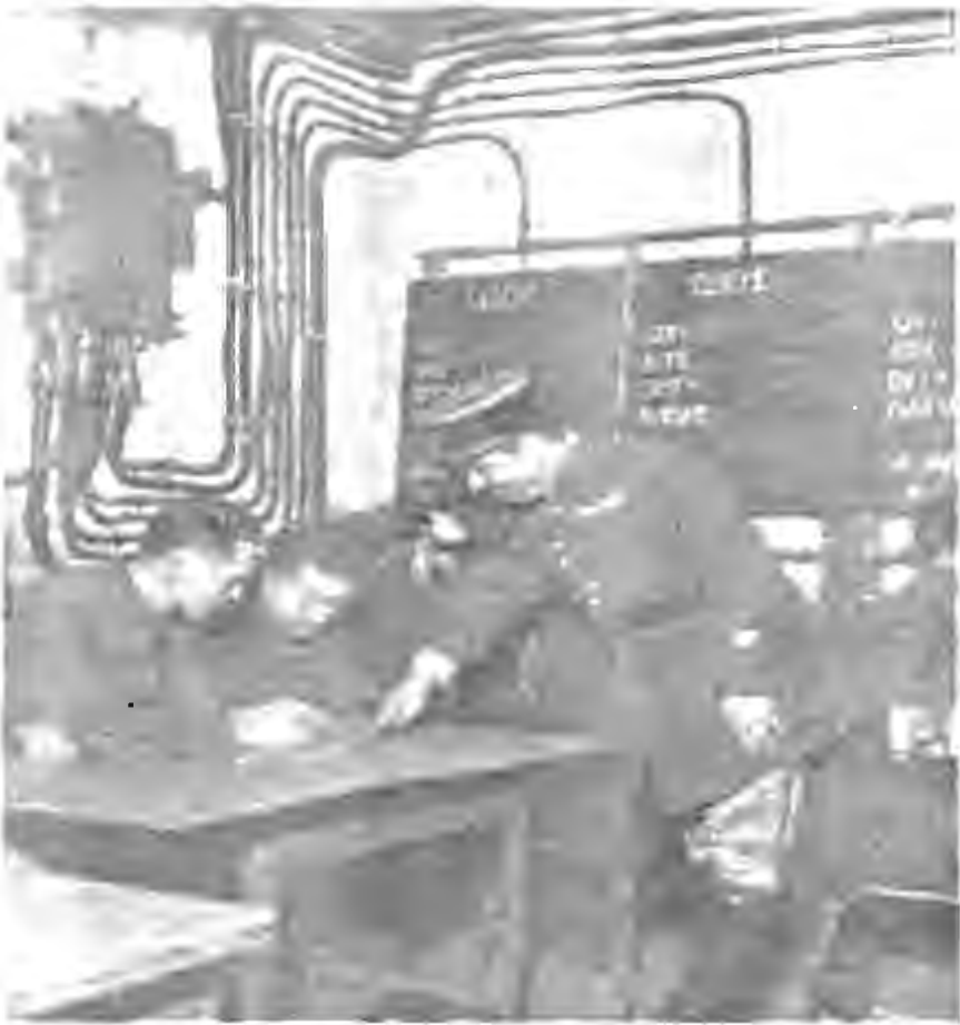
غرفة للعمليات داخل حصون ماجينو