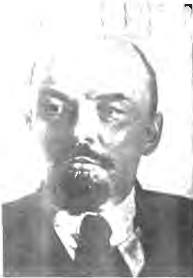
لينين (١٨٧٠ - ١٩٢٤)