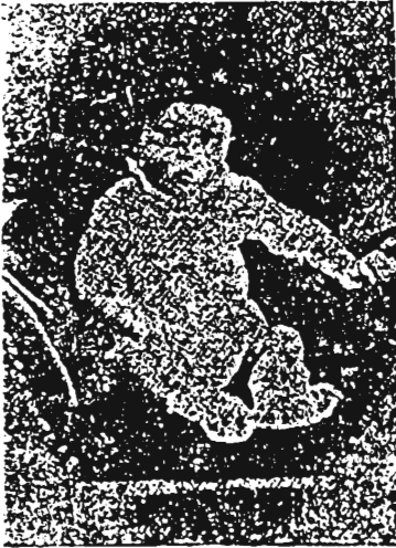
أدولف هتلر في عامه الأول

شاء حسن الطالع أن أبصر النور في برونو ، المدينة الصغيرة الواقعة على الحدود الفاصلة بين ألمانيا والنمسا الدولتين الألمانيتين اللتين يجب أن يكون اتحادهما محدداً في رأس الأهداف التي نعمل لها في الحياة . فالنمسا الألمانية يجب أن تعود إلى حضن الوطن الألماني الأكبر لأن الدم الواحد هو ملك الوطن الواحد . ولن يكون الشعب الألماني ذا حق في أي نشاط استعماري ما لم يحجم أبناءه في دولة واحدة ، ومضى احتوى الربيع