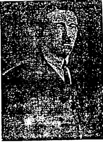
أدولف هنتر عام ١٩٢١

ما علق بالأذهان حول استحالة قيام حركة جديدة قادرة على الوقوف في وجه الماركسة والتغلب عليها .