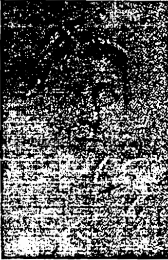
والدة أدولف هتلر

وفي أوقات الفراغ كنت أغزو مكتبة والدي وأنكبّ على تصفّح كتب التاريخ والمجلاّت المصوّرة ، فوعدت ذات يوم على مجلة كانت تصدر في