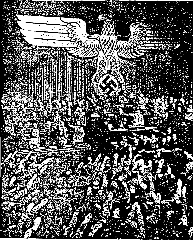
هتلر في موقف خطابي

لحزبنا بوضع حدّ لهذا التعاون المسيء إلى حركتنا الصاعدة ، وكانت حجتي أن حركة قوية تخسر الكثير بتعاونها وحركات أضعف منها ، ونبهت الأفكار إلى حقيقة ما كان يضمره زعماء المنظمات ، فقلت إنهم جماعة من المشتغلين بالسياسة ، استهوتهم فكرتنا، وبدلاً من أن ينضموا إلى حركتنا ويعملوا في