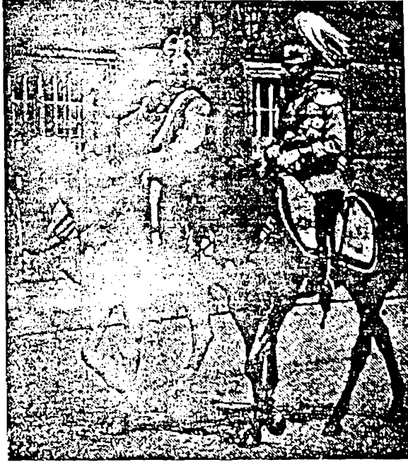
الامبراطور غليوم الثاني والملك جورج الخامس

ذلك بأن بعض المفاهيم الفلسفية الشائعة اليوم يعزو إلى الدولة طاقة الإبداع والتمدين ويذهب إلى أن الدولة هي وليدة ضرورات اقتصادية، وفي بعض الحالات الفضلى ، وليدة نشاط القوى السياسية . وهذا المبدأ الأساسي يعر حتماً إلى تجاهل القوى البدائية المرتبطة بالعنصر وإلى الانتقاص من قيمة الفرد .