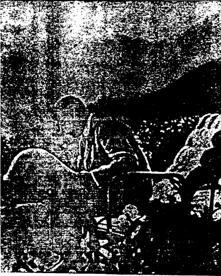
أهولت هتلر في فترة راحة واستجمام

نسوا ذلك كله ليدخلوا في جدل عقيم حول قضايا بعيدة عن جوهر الدين بعد الأرض عن السماء : و « تطوعت » الصحف الماركسيّة والملاحدة لصب الزيت على النار بنشرها آراء سخيّة للجانبين . وبدلاً من أن يبادر العنصريون