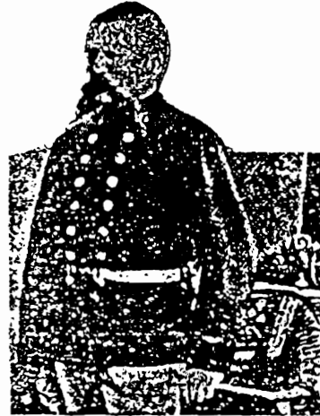
والد أدولف هتلر

العام ١٨٧٠ ، وفيها وصف أخذ الحرب بين بروسيا وفرنسا . وقد تساءلت وأنا أنتبّع خطى الجيش البروسي المظفر : أين كان ألمان النمسا يومئذ ؟ ولمّ تخلف والدي وسائر النمساويين عن السير في موكب النصر ؟ وهل ثمة فرق