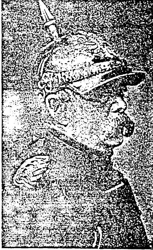
بمرك المستشار المديني الذي حقق الوحدة الألمانية

الرفّ لأن العمران كان آخر ما يخطر ببال الناس في تلك الفترة العمسية . قررت الاشتغال بالسياسة وادعماً نصب غيبي إنقاذ ألمانيا من عدوين : الماركسية واليهودية . وقد كان غليوم الثاني أول امبراطور أثنائي مدته إلى زعساء الماركسية وقد فاتته أن المخادع لا يتركن إليه . فقد صانحوا غليوم بيد بينما كانت الأخرى تتحسّن الخنجر .